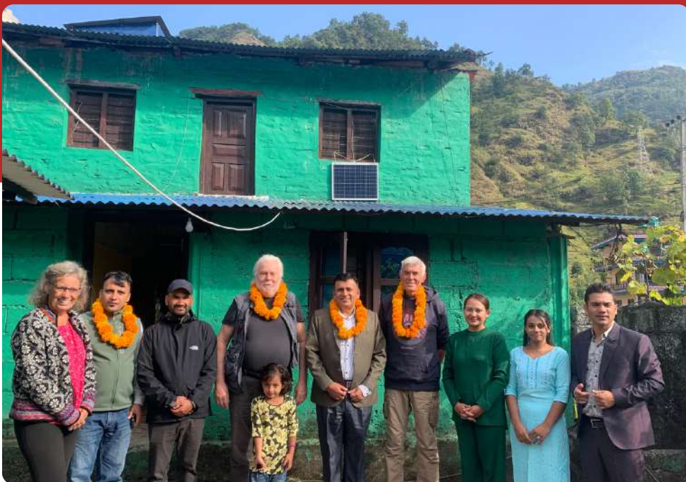
Foto: afgevaardigden van WVAF, JHF, Stichting Nepal en Nepali Children

Aan het begin van het jaar ontvangt u dan een factuur voor de totale jaarbijdrage, die u in delen kunt voldoen. En na afloop van het jaar ontvangt u van ons een opgave voor uw belastingaangifte.